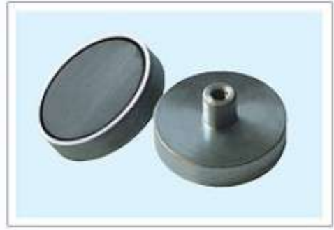
内凸孔螺纹磁盖 POT08-第一页